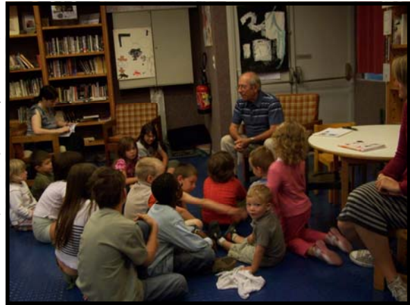
Contes Vietnamiens aux enfants

Nous sommes bien obligés de constater une baisse de nos rentrées financières dans les caisses de notre association. Pour pallier ces difficultés, et pour poursuivre nos projets solidarité à un bon niveau, nous avons du accepter de nous investir dans de nouvelles initiatives, dans les centres de vacances ou ailleurs. Comme vous pouvez le constater, le calendrier d'activités est bien rempli.