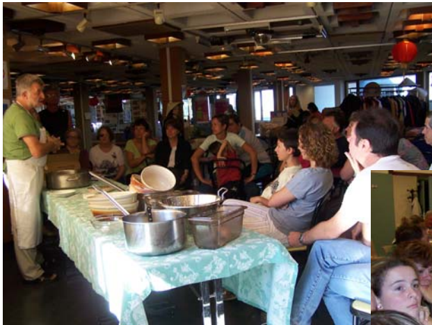
Cours de cuisine vietnamienne